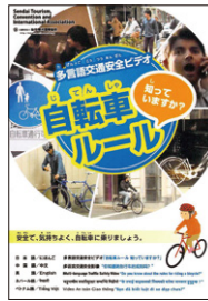
交通ルールリーフレットとDVD