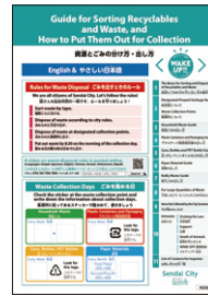
ごみ出しルールリーフレットとDVD