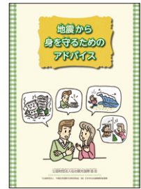
防災リーフレットとDVD

※ご希望の時間や内容で対応しますので、ご相談ください。(短時間でも実施可能です)