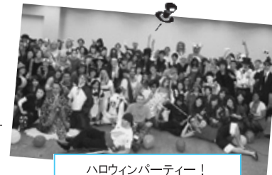
ハロウィンパーティー!

「ふりすく」とは、フリー(Free)スクール(School)の略称です。私たちふりすく仙台は、外国人は日本人に対して主に英語を、日本人は外国人に対して日本語を教えることで、国籍の違う友達を作りながら言語交換を行うグループです。レッスンを通して、単なる国際交流だけではなく、海外への夢や目標に向かう人にとって目標達成に貢献する場でありたいと、ふりすく仙台は考えています。本気で英語力を向上させたい、日本語を教えながら文化交流したいと考える人が自分の可能性を広げようと日々活動しています。国籍を超えて助け合い、未来に向けて努力する、そんな魅力的な人が集まる団体です。