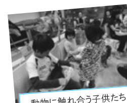
動物に触れ合う子供たち

発足しました。日本唯一のアフリカを対象とした連続セミナーです。会場は交流コーナーの研修室。基本的に毎月第3木曜の午前中に、第一線で活躍している専門家をお招きして開催していますが、随時、時事的な問題なども取り上げています。例えば、本年度は、東日本大震災関連の講義を多く取り入れました。その延長上で、仮設住宅の子どもたちを八木山動物公園に招待し、動物との触れ合いを楽しんでいただく企画も実現しました。一般の参加者からは一回700円、会員登録者は500円の参加費をいただいで、会の運営費に充てています。終了後は講師と昼食を食べながらの歓談も行っています。