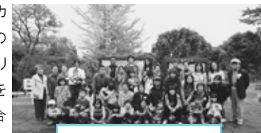
八木山動物園にて

本セミナーの会は、アフリカをもっと知りたいという市民の声を受け止め、今日のアフリカが抱えるさまざまな問題を深く学び、考え、かつ語り合うことを目的として1997年に