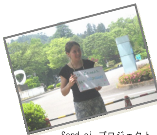
Send ai プロジェクト