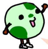
マスコットキャラクター チッキー

今年の来場者数はなんと約4,200名! たくさんの方にご来場いただきました♪ どんな様子だったか、のぞいてみましょう～