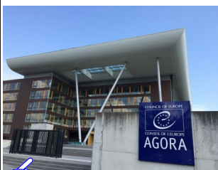
(欧州評議会の「アゴラ・ビルディング」)

「インターカルチュラル・シティ」とは、移住者や少数者によってもたらされる文化的な多様性を、脅威ではなくむしろチャンスととらえ、都市の活力や革新、