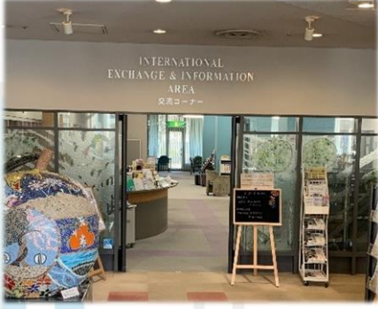
साँस्कृति आदानप्रदान कर्नरको प्रवेश द्वार

सेन्दाई अन्तर्राष्ट्रिय केन्द्र साँस्कृति आदानप्रदान कर्नर बाट सेन्दाई बहुसांस्कृतिक समाज केन्द्र सम्म