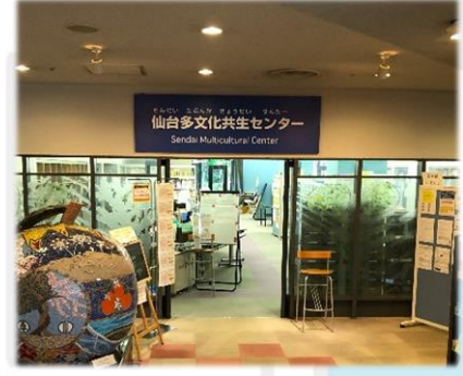
बहुसांस्कृतिक समाज केन्द्रको प्रवेश द्वार