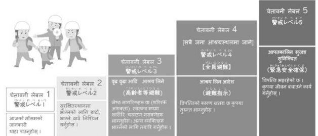
लेवल 1 देखि 5 को नम्बरमा क्रमिक रूपमा जोखिम बढ्दैछ।

अबबाट, अहिले बसेको स्थान चाँही खतरा भएका व्यक्ति तुरुन्त भाग्न नसक्ने व्यक्ति भएमा 「चेतावनी लेवल 3」 को 「बृद्ध ब्रिद्धा आदि आश्रय लिने」 हरुमा भाग्ने । त्यस बाहेकका व्यक्तिहरु पनि 「चेतावनी लेवल 4」 को 「आश्रय लिन आदेश」 सबै जना भाग्ने ।