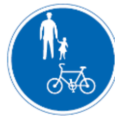
Дорожній знак (Тільки для велосипедів і пішоходів)