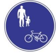
Для велосипедів та пішоходів