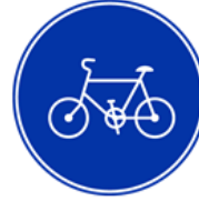
Тільки для велосипедів