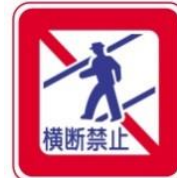
Пішохідний перехід заборонено