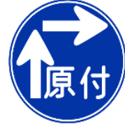
Поворот праворуч для моторизованого велосипеда