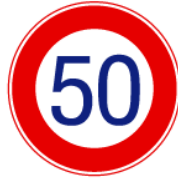
Ліміт швидкості 50 км/год