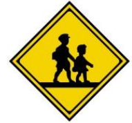
Поблизу школа, яслі, дитячий садок