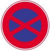
Паркування й зупинка заборонені