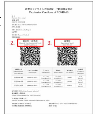
(खोप लगाएको प्रमाणपत्रको नमुना)