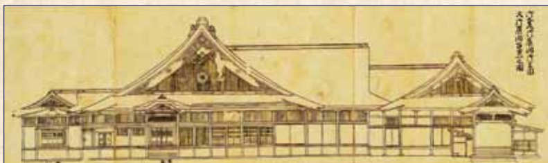
「千田家姿絵図(本丸大広間部分)」

本丸には「表」と「奥」とに分かれて数多くの御殿建物が建てられ、その中心が慶長15年(1610)に完成した「大広間」でした。大広間には全部で14の部屋があり、周囲に廻る縁側を合わせると約430畳もの広さがある桃山建築の粋を集めた豪華な建物でした。また大広間の北には「能舞台」、東の崖際には「懸造」がありました。