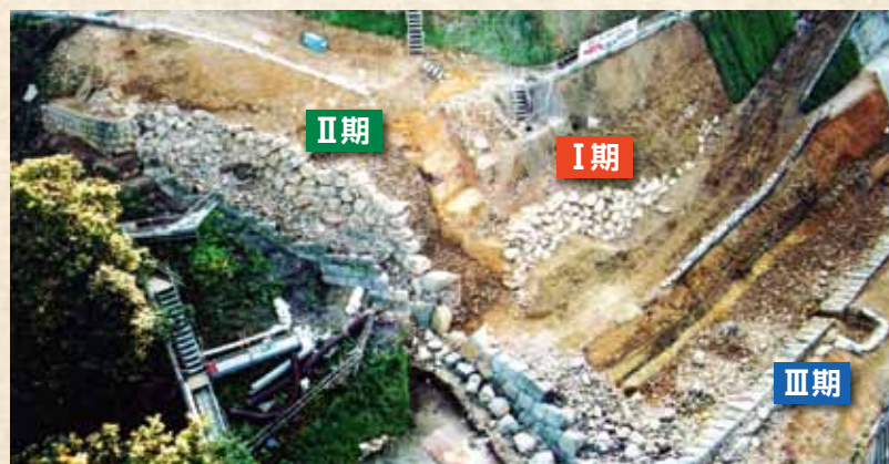
本丸跡北東部の石垣(北東から)

本丸北壁石垣は、平成9年～平成16年にかけて修復工事が行われ、工事に伴う発掘調査で、現在の石垣の裏側から、2つの時期の古い石垣が発見されました。最も古いⅠ期石垣は、政宗が築城した17世紀初頭のもので、自然石を加工せず、長いほうを横方向にして積んでいます。次の段階のⅡ期石垣は、17世紀前半のもので、自然石に多少加工を加え、長いほうを前後にして積んでいます。現在のⅢ期石垣は、寛文8年(1668)の地震の復旧のために17世紀後半に築かれたもので、全面が加工された「切石」を、目地をそろえて積んでいます。