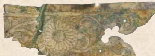
発掘調査で見つかった金銅金具

「上段の間」のコーナーでは、床の間を実寸大で再現しています。その大きさと華麗な障壁画をご覧ください。