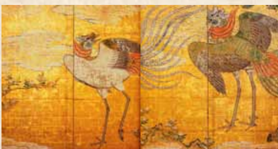
「鳳凰図屏風」(松島町所蔵)

「上段の間」のコーナーでは、床の間を実寸大で再現しています。その大きさと華麗な障壁画をご覧ください。