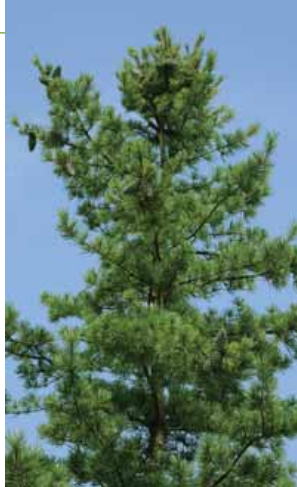
チョウセンゴヨウ(常緑)