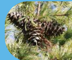
チョウセンゴヨウ