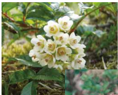
タカネナナカマド