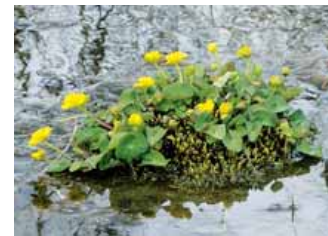
エゾノリュウキンカ