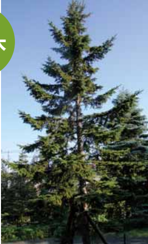
アカエゾマツ(常緑)