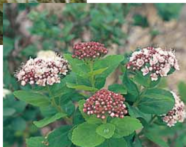
エゾマルバシモツケ