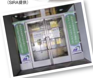
▲仙台市災害多言語支援センター入口