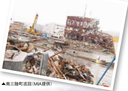
▲南三陸町巡回