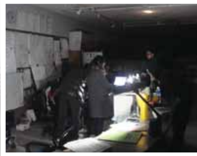
▲震災2日目 停電中の電話対応