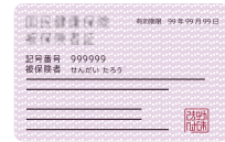
National health insurance card or other forms of official ID