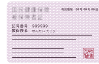
けんこうほけんしやう 健康保険証