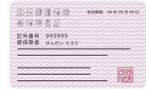
Thẻ bảo hiểm y tế , V.V.