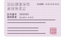
स्वास्थ्य बीमा कार्ड