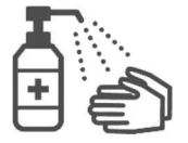
손소독 알코올로 손 위생 시행

내용이 변경될 수 있으므로, 최신 정보는 센다이시 코로나 19 백신 포털 사이트에서 확인하시기 바랍니다.